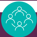
Table de concertation

La vision de l'organisation est celle d'une société égalitaire où une diversité de femmes et de filles exercent leur pouvoir d'influence et leur leadership pour l'avancement de la condition féminine, au bénéfice de leur communauté.